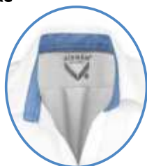
CUELLO ITALIANO Rígido con varilla