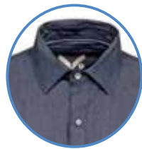
CUELLO ITALIANO Rígido con varilla