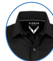
CUELLO ITALIANO Rígido con varilla