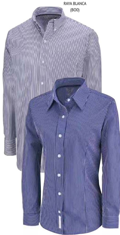
RAYA BLANCA (BOO)

Dama Raya BLUAFANRYADLAP3 Caballero Raya CAMAFANRYACLAP3 De XCH a 3XG 60% Poliéster 40% Algodón