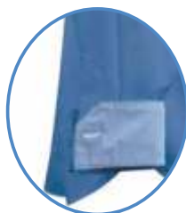
COMBINACIÓN EN CUELLO Y PUÑOS