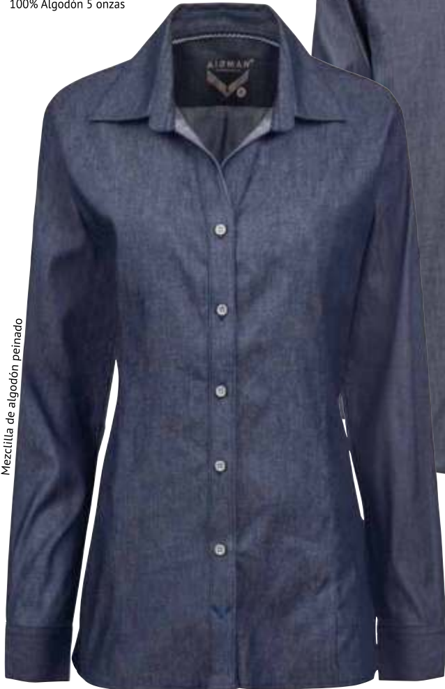
AZUL STONE (AZ6)