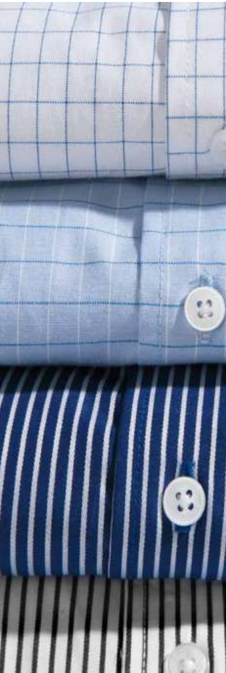
CUADRO BLANCO (BO)