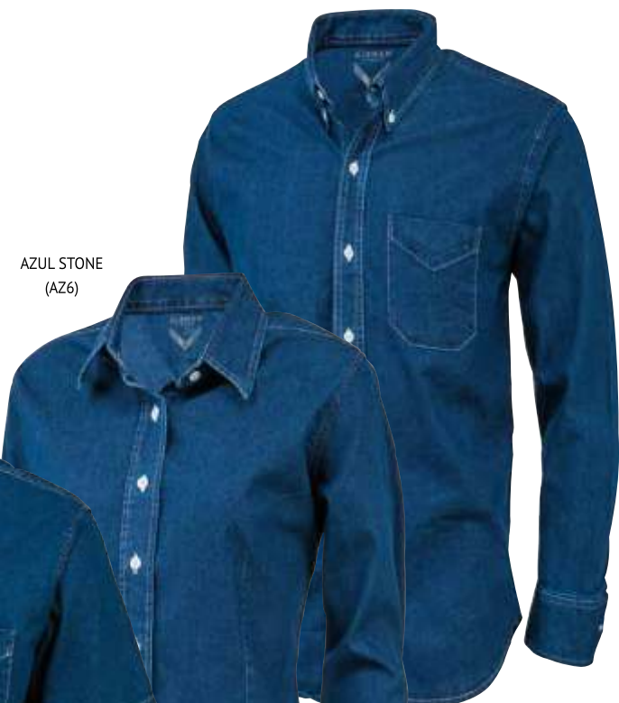
AZUL STONE (AZ6)